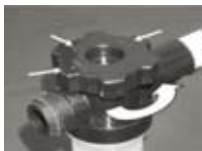
Tuerca en el pivote. Pivote de 11 direcciones con la boquilla rociadora.